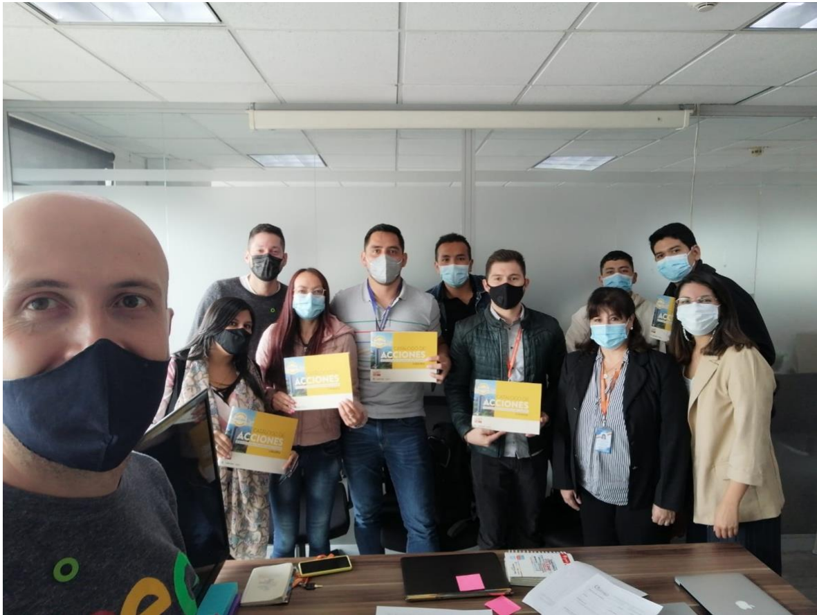
Figura 1. Visita presencial para socialización y desarrollo de la visión de descarbonización en Cundinamarca.